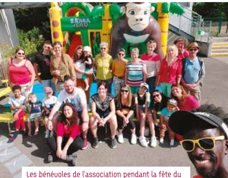
Les bénévoles de l'association pendant la fête du jeu de juillet 2023