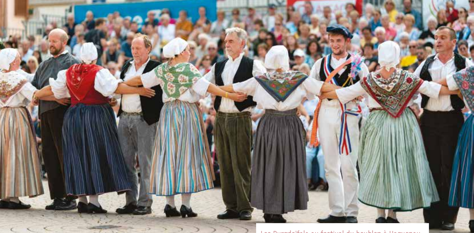
Les Burgdeifala au festival du houblon à Haguenau, août 2022